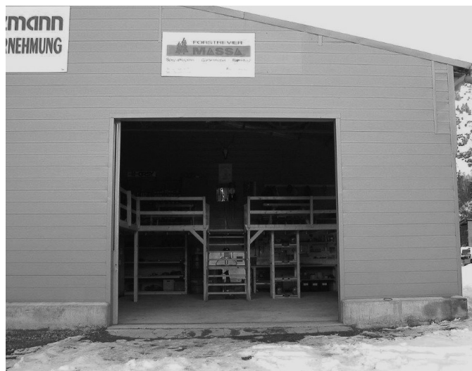
Der Werkhof des Forst Massa zügelt von Naters ...

Für Forst Massa, ein Zweckverband der Bürger- und Einwohnergemeinden Naters, Mörel und Bister, beginnt Ende Mai eine neue Zeitrechnung. Das Forstrevier zieht von Naters in den neuen Werkhof «Bilderne» in Mörel-Filet.